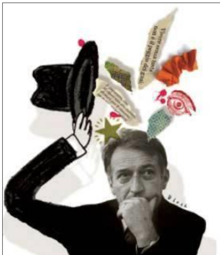
Omaggio a Gianni Rodari

La creatività è senza dubbio la risorsa umana più importante. Senza creatività non ci sarebbe progresso e ripeteremmo sempre gli stessi schemi.